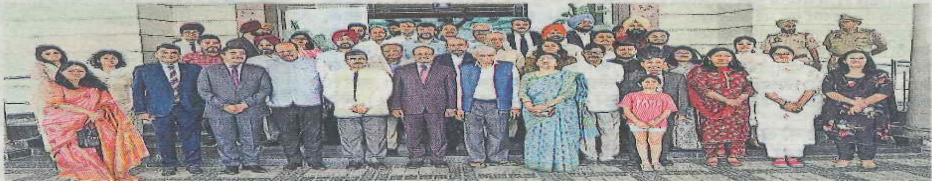
सम्मेलन में हिस्सा लेने के उपरांत जानकारी देते हुए गणमान्य